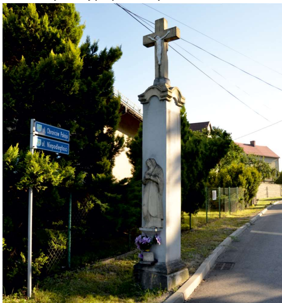
Boża Męka, jedyny świadek istnienia w tym miejscu pierwszego kościoła pszowskiego