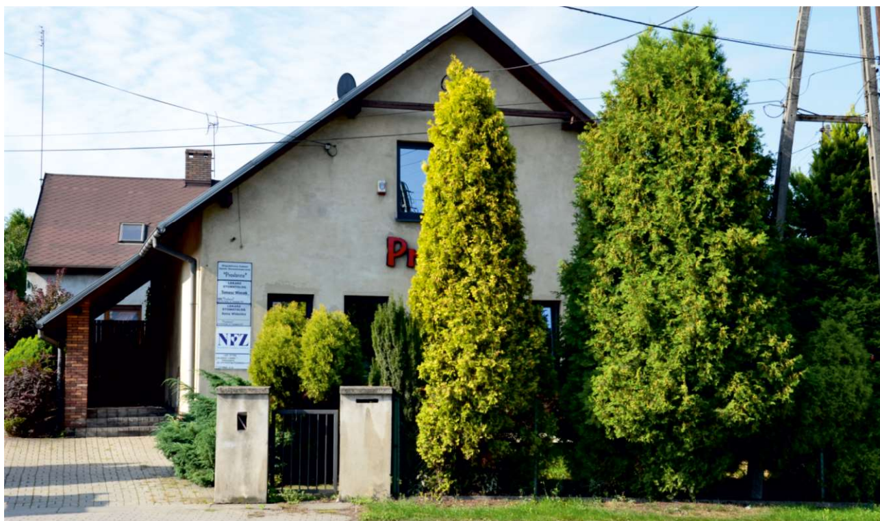
Budynek stoi w miejscu dawnego kościółka. Obecnie mieszczą się w nim pracownice dentystyczne. Podczas kopania fundamentów pod domy powyżej, natrafiono na kości z przykościelnego cmentarza. Budynki stoją więc na dawnym cmentarzu